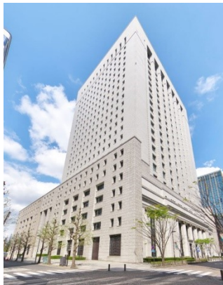
第一生命日比谷ファースト

移転先ビルは、2022年より“ポストコロナ時代のウェルビーイング※が高まるオフィスビル”をコンセプトに大規模リノベーションが着工された「第一生命日比谷ファースト」